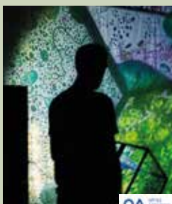
Avec le soutien de